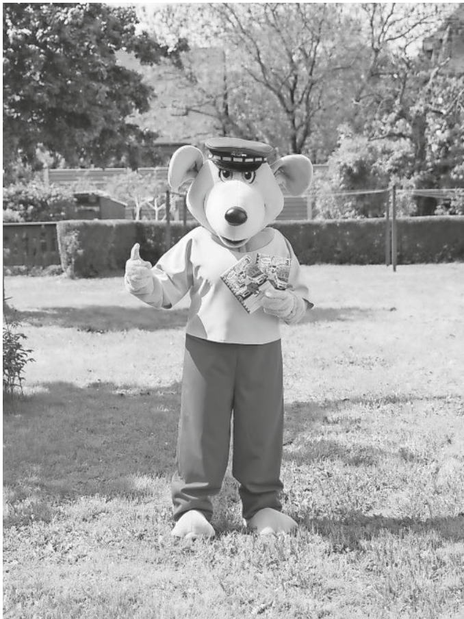
BILLY, das Polizeikänguru

Es ist noch offen, welche genaue Summe und Vorgabe der RVF vom Land erhält. Deshalb wird der Verbund zunächst auf einen SchülerAbo-Monatsbetrag verzichten. „Sobald wir hier Klarheit haben und die Mittel bei uns angekommen sind, entscheiden wir umgehend über eine weitere Entlastung für die Eltern“, sagt Kurt.