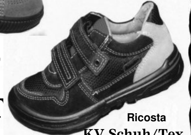
Ricosta KV Schuh/Tex