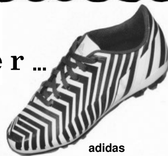
adidas Predito FG Jr.