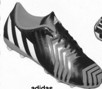
adidas Predito TRX FG Jr.